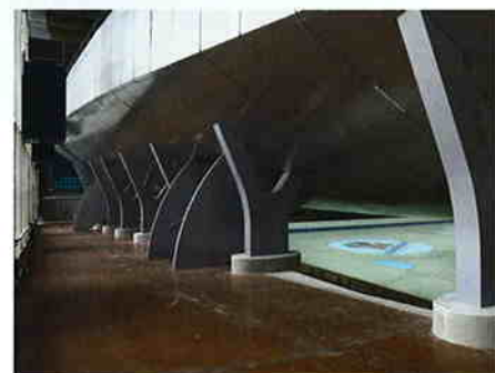
Gros plan sur les «Y» porteurs.

La coque métallique en plaquage d'aluminium semble «flotter» sur sa base.