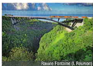
Ravine Fontaine (I. Réunion)