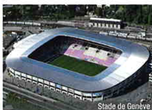
Stade de Genève