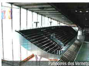
Patinoires des Vernets

T ingénierie sa ingénieurs civils epf sta usic