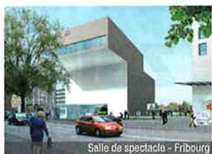
Salle de spectacle - Fribourg