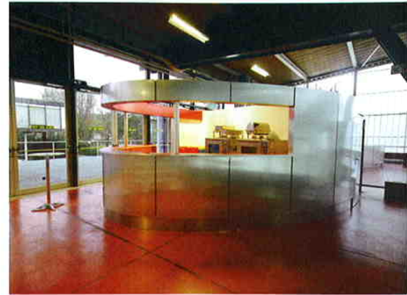
Les éléments fonctionnels tels que les buvettes et les sanitaires expriment leur contemporanéité.