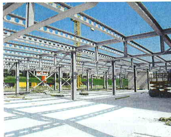
La société B. Braun Medical SA emploie quelque 300 personnes dans son centre de Crissier. Le nouveau bâtiment accueillera de nouvelles lignes de production.

Active en Suisse romande depuis 1983, la société a installé à Crissier un Center of Excellence (CoE) pour les solutions de remplissage vasculaire et la production de poches souples pour alimentation parentérale et perfusions médicamenteuses. Trois cents des 750 employés suisses de la firme y sont regroupés.