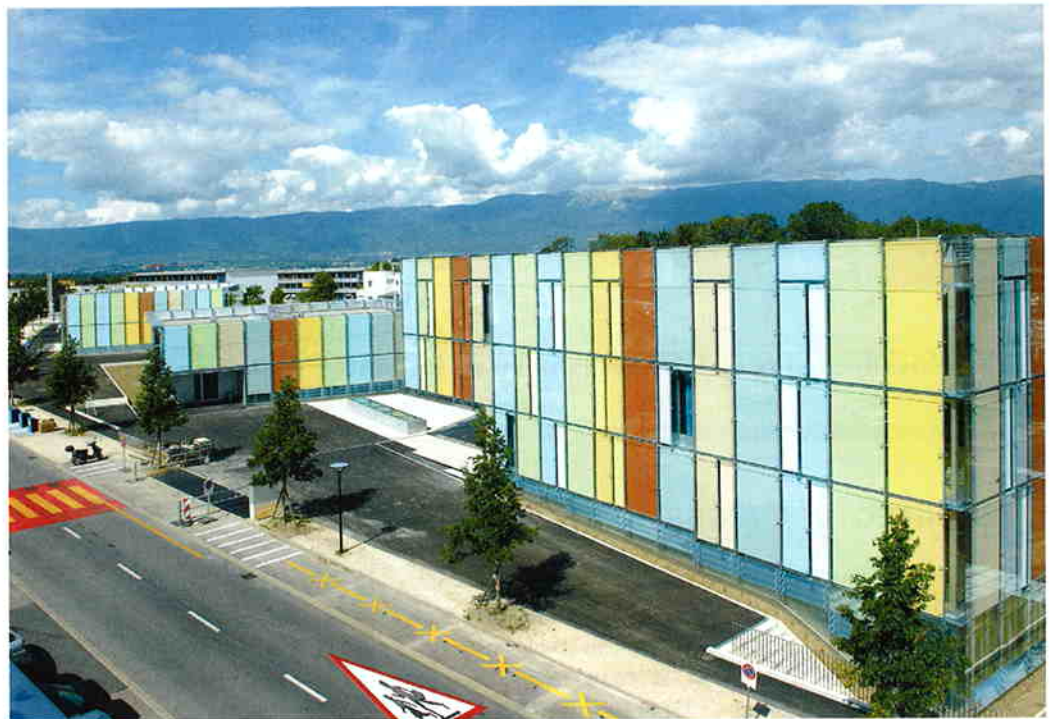
Le groupe scolaire de Cressy, un ensemble résolument original.

Mais c'est surtout à la tombée de la nuit que la magie opère, les façades des bâtiments s'illuminant alors de mille couleurs. Pour parvenir à cette féerique alchimie, les architectes Devanthery & Lamunière ont fait appel à Daniel Schlaepfer, un «sculpteur-lumière» travaillant à Lausanne. Son tour de passe-passe: un modèle informatique qui mémorise la quantité de lumière reçue par les bâtiments durant la journée. A partir de quatre gammes de couleurs de base plus ou moins intenses, une pour chaque saison, l'éclairage tout en nuance reflètera aussi bien l'ambiance d'un jour d'automne, riche en tons jaune et orange, que celle d'une journée éclatante du mois de juillet, avec un beau bleu azur. Il est aussi possible de varier les teintes en fonction des événements. Si le site est à la